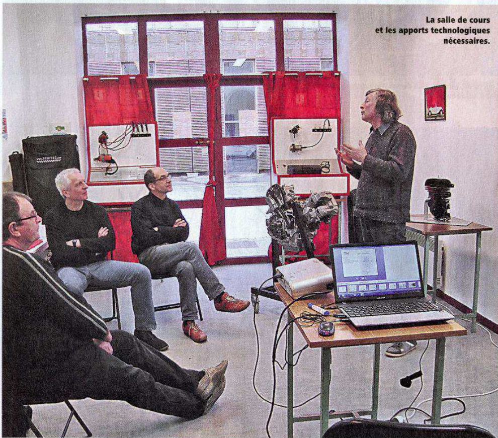
La salle de cours et les apports technologiques nécessaires.