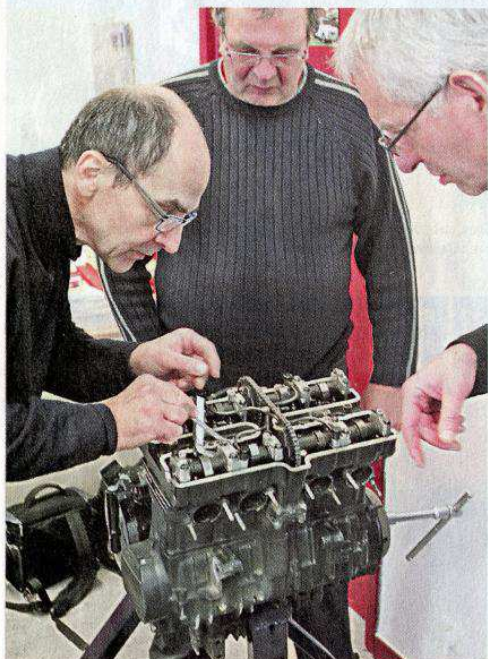
▲ Réglage du jeu aux soupapes sur un 650 Kawa à double ACT et basculeurs. Les stagiaires peuvent s'essayer aussi au pastillage sur un autre moteur.

Trouver un centre de formation dédié 100 % aux anciennes n'est pas chose facile... et pour cause, il n'y en aurait qu'un seul de ce type en France ! LVM l'a déniché pour vous et a participé au stage de février.